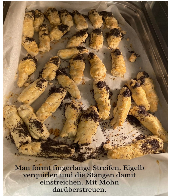
Man formt fingerlange Streifen. Eigelb verquirlen und die Stangen damit einstreichen. Mit Mohn darüberstreuen.