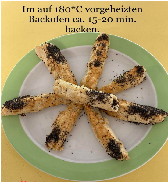
Im auf 180°C vorgeheizten Backofen ca. 15-20 min. backen.